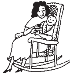
d. dar a luz

3 Lee las oraciones y decide si cada una es cierta (C) o falsa (F).