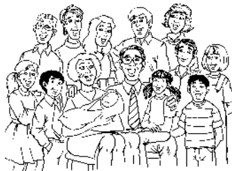
c. la reunión familiar